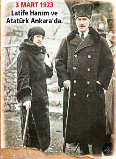
3 MART 1923 Latife Hanım ve Atatürk Ankara'da.