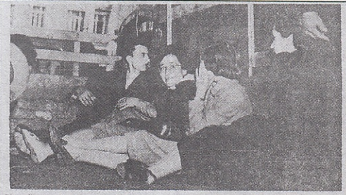
Dün polis nezaretinde Laleli'deki Çiçekpalaş salonundan tahliye edilmiş kızıl erkekli komünist taraftarları kamyonu bindirdikten sonra.